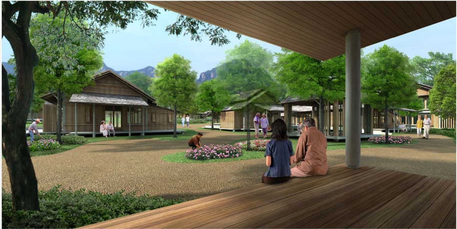
The Learning Center for Holistic Healthcare for the Elderly and Hospice Care, Mahidol University