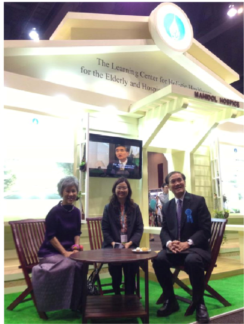
The Learning Center for Holistic Healthcare for the Elderly and Hospice Care, Mahidol University