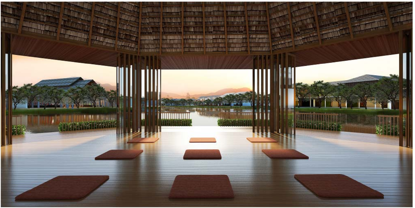
The Learning Center for Holistic Healthcare for the Elderly and Hospice Care, Mahidol University