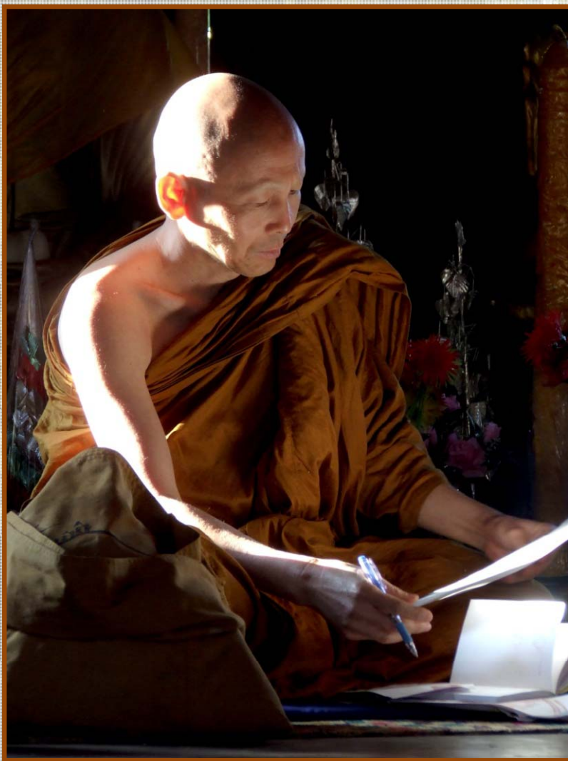
Phra Paisal Visalo