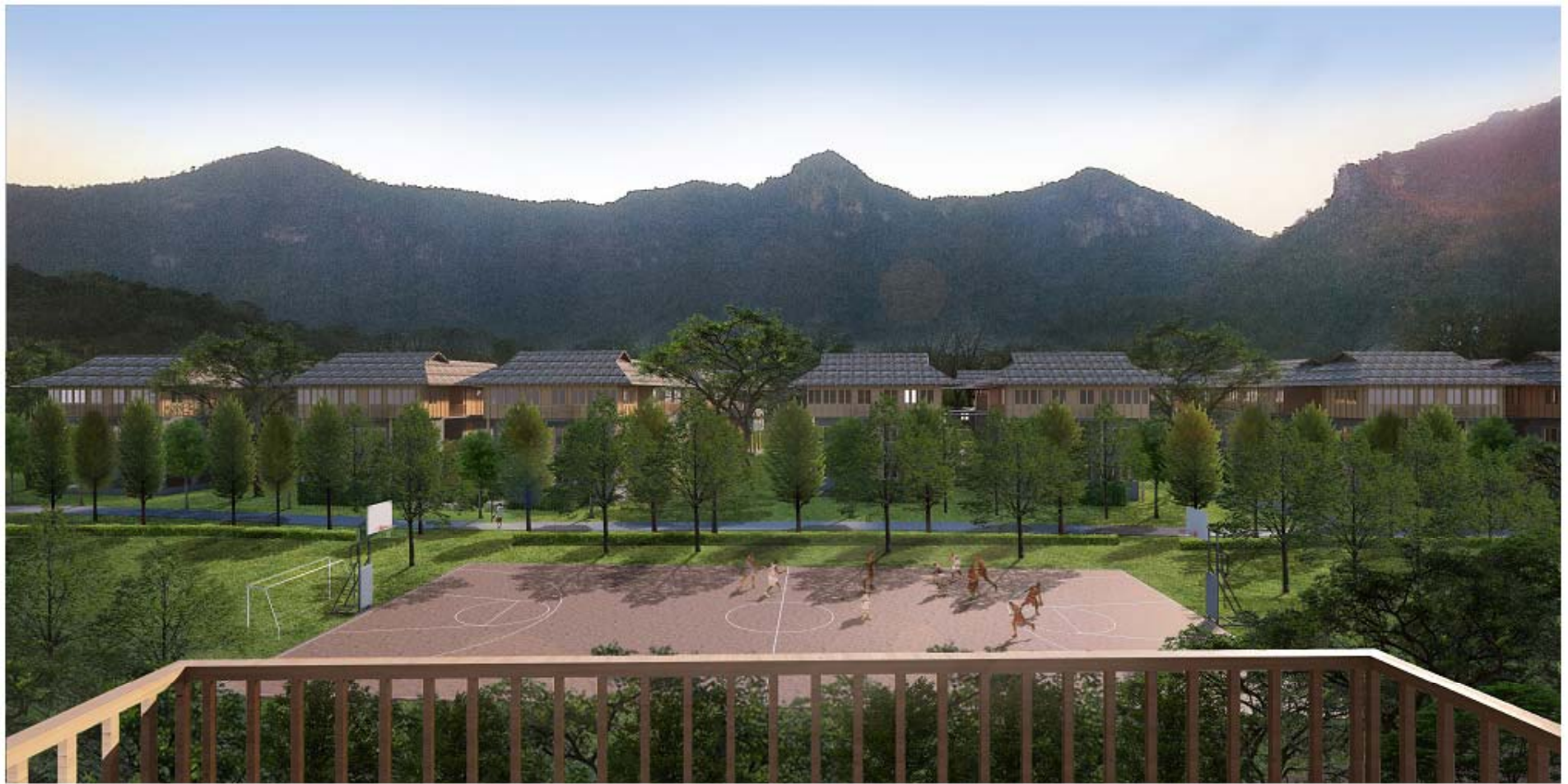
The Learning Center for Holistic Healthcare for the Elderly and Hospice Care, Mahidol University