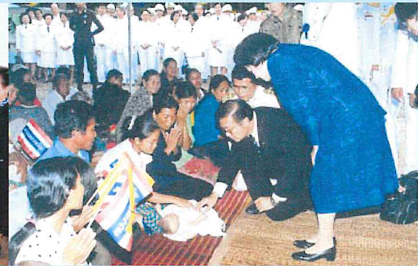
สมเด็จพระเจ้าพี่นางเธอ เจ้าฟ้ากัลยาณิวัฒนา กรมหลวงนราธิวาสราชนครินทร์ เสด็จทรงเปิดศูนย์โรคเขตร้อนนานาชาติราชชนครินทร์ หรือ RTIC (Rajanagarindh Tropical Disease International Center) เมื่อวันที่ ๙ มีนาคม พ.ศ. ๒๕๔๔