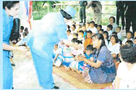
เสด็จเป็นการส่วนพระองค์เยี่ยมชมกิจการของสถานีวิจัยหลังเก่าและเยี่ยมเยียนราษฎรบ้านหัวน้ําหนัก เมื่อวันที่ ๔ พฤศจิกายน พ.ศ. ๒๕๔๑