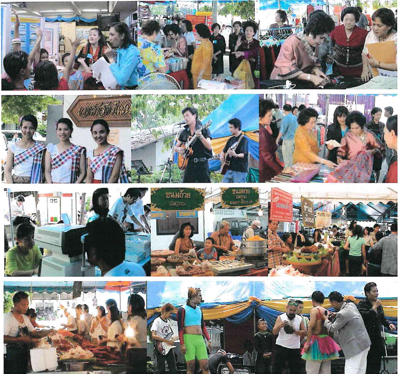
ประมวลภาพกิจกรรมบันเทิงและจำหน่ายสินค้าราคาถูก