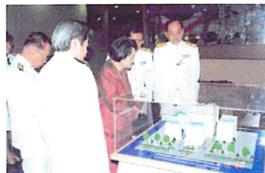
เสด็จทรงเปิดอาคารเฉลิมพระเกียรติ เมื่อวันที่ ๑ ธันวาคม พ.ศ. ๒๕๔๓