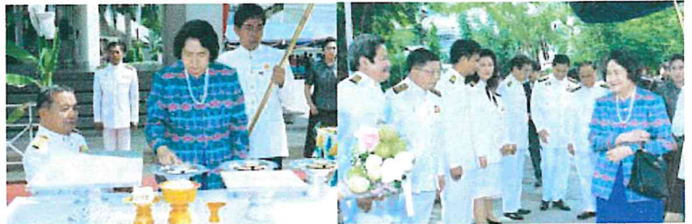
เสด็จทรงวางศิลาฤกษ์อาคารฯ เมื่อวันที่ ๑๙ พฤษภาคม พ.ศ. ๒๕๔๑

สมเด็จพระเจ้าพี่นางเธอ เจ้าฟ้ากัลยาณิวัฒนา กรมหลวงนราธิวาสราชนครินทร์ ทรงพระกรุณาเสด็จคณะเวชศาสตร์เขตร้อน รวม ๓ ครั้ง คือ เสด็จทอดพระเนตรพื้นที่ที่จะทำการก่อสร้างอาคารเฉลิมพระเกียรติ เมื่อวันที่ ๙ กรกฎาคม พ.ศ. ๒๕๓๙ เสด็จทรงวางศิลาฤกษ์อาคาร เมื่อวันที่ ๑๙ พฤษภาคม พ.ศ. ๒๕๔๑ และเสด็จทรงเปิดอาคารเฉลิมพระเกียรติ เมื่อวันที่ ๑ ธันวาคม พ.ศ. ๒๕๔๓