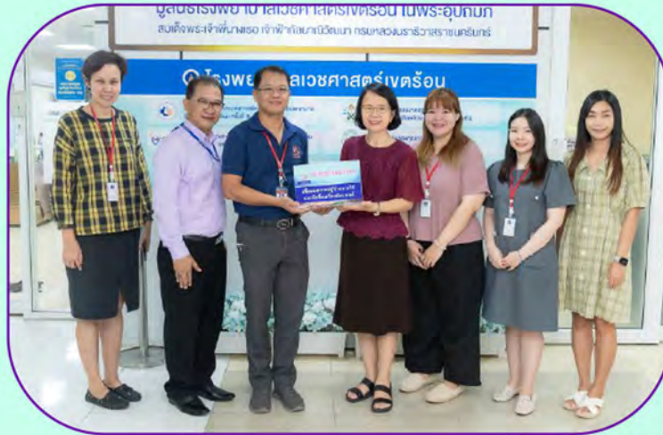
คณะกรรมการอนุรักษ์พลังงานและสิ่งแวดล้อม คณะเวชศาสตร์เขตร้อน มอบเงินบริจาคสมทบทุนจากผู้มีจิตศรัทธา จากการจัดงานวันสิ่งแวดล้อมโลกประจำปี 2566 คณะเวชศาสตร์เขตร้อน วันที่ 29 มิถุนายน 2566